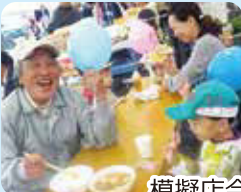
模擬店会場の様子