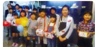
子どもスタンプによる共同募金活動

うながっぴが参加した抽選会では、多くの景品がスタンプラリー参加者に 当たり、大いに盛り上がりました。