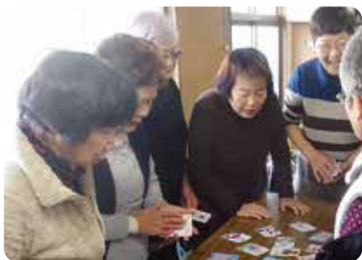
★カルタ取りに真剣な表情

地域住民の交流と健康作り、認知症予防を目的に地域の集会所で開かれているサロンです。地域のみなさんが中心となってわいわい楽しく活動しており、どなたでも気軽に参加できる憩いの場となっています。