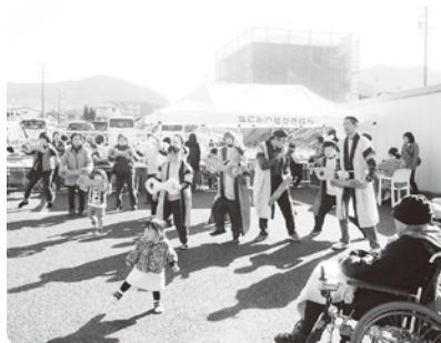
利用者によるソーラン節