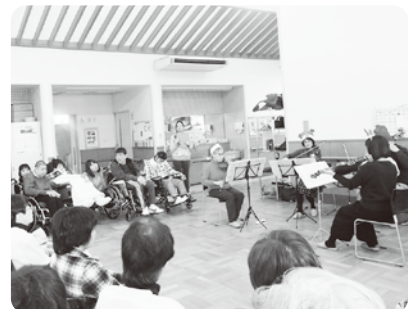
Nアンサンブルの演奏