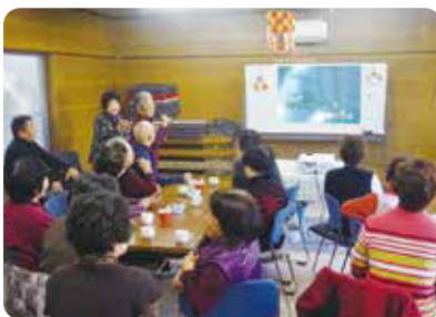
★カラオケを楽しむみなさん