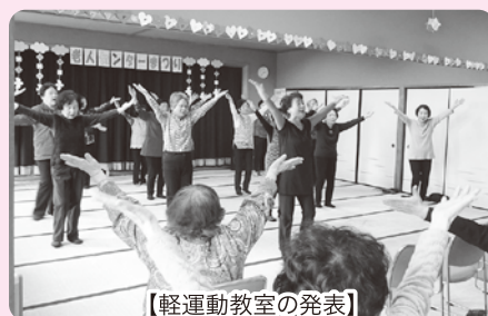
【軽運動教室の発表】