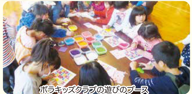
ボラキッズクラブの遊びのブース