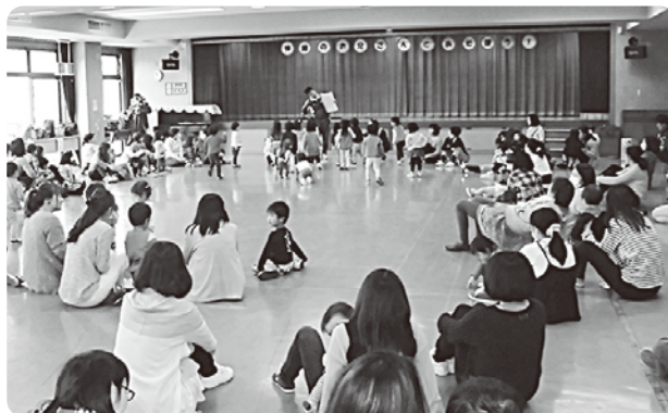
たくさんの親子が参加しました