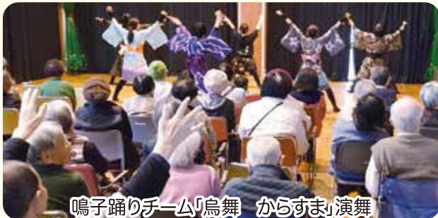
鳴子踊りチーム「烏舞 からすま」演舞

3月10日に恒例の「サンホーム滝呂春まつり」を開催しました。地域内外の方々の協力を得て、ヨガ体験やシニアメイク、母親クラブのバザー、飲食販売などたくさんのブースを設け、多くの地域の方に来場していただき、とても賑わいました。