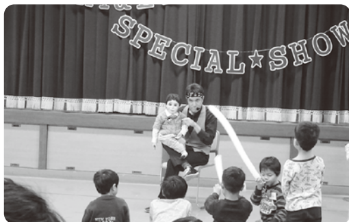
KACHI & LEOによる腹話術

新一年生のみなさん、入学おめでとうございます！ 小学校でも元気にがんばってくださいね！！