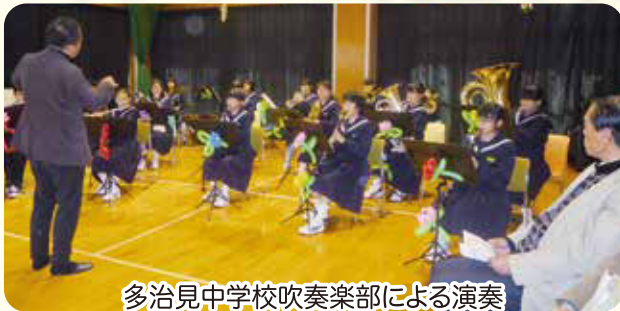
多治見中学校吹奏楽部による演奏