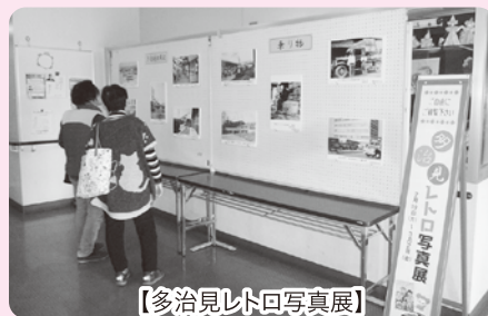
【多治見レトロ写真展】