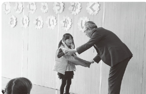
新一年生のみなさんに記念品を贈りました