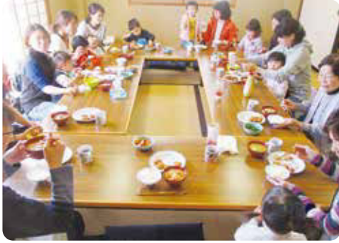
みんなでおいしく楽しくいただきま〜す

子育ての親子交流を目的として、地域で開かれているサロンです。活動内容としては、親子で料理教室や絵本の読み聞かせなどを行っています。 また、クリスマス会を12月に開催しており、毎年たくさんの親子が参加しています。