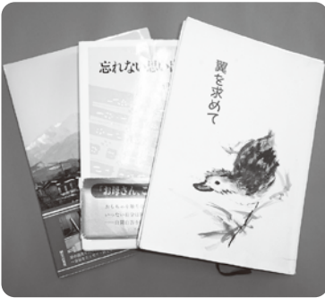
伊藤さんが執筆された随筆集