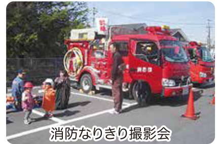
消防なりきり撮影会

3月3日に毎年恒例「ふれあいセンター姫まつり」を開催しました! 消防士・警察官のなりきり体験、スタンプラリーなど楽しいイベントが盛りだくさんでした。