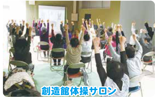
創造館体操サロン

日時 毎週月曜日 午前10時～正午 場所 市役所本庁舎1階 講座や体操などの後に茶話会を開催し、地域のつながりをつくっています。 ※TGKとは多治見元気高齢者の略です。