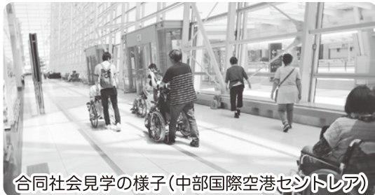
合同社会見学の様子(中部国際空港セントレア)