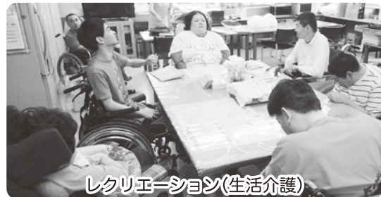
レクリエーション(生活介護)