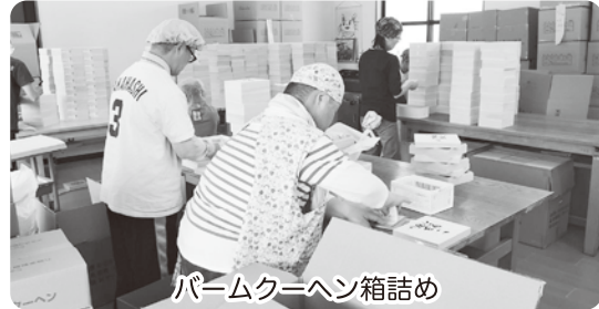
パームクーヘン箱詰め

生活の改善、身体機能の維持向上を目的として、入浴・排せつ・食事などの介助や創作的活動の機会の提供といったサービスを通して、障がいのある方の社会参加と福祉の増進を支援しています。