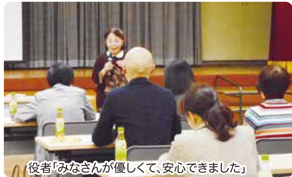
役者「みなさんが優しく、安心できました」

認知症になっても住み慣れた地域で安心して暮らせるまちづくりを目指して、今後は地域のみなさんにも参加を呼びかけて、訓練を継続します。