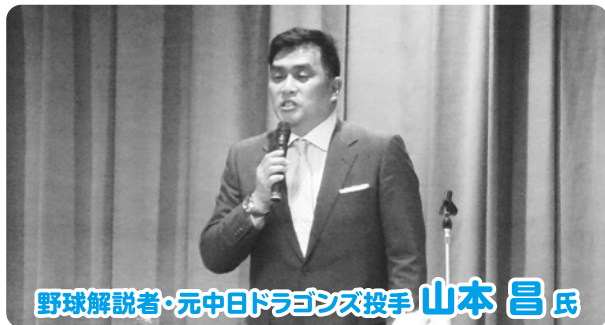
野球解説者・元中日ドラゴンズ投手 山本 昌 氏