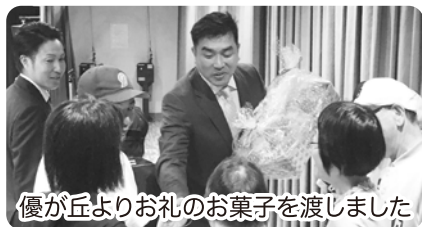
優が丘よりお礼のお菓子を渡しました