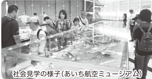
社会見学の様子(あいち航空ミュージアム)