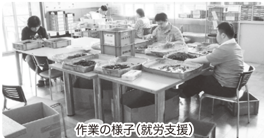
作業の様子(就労支援)

笠原にあるなごみの杜がさはらは、毎日20名の方が通う施設です。優が丘と同様、仕事(作業)を中心に過ごす方(就労継続支援B型支援事業)や、入浴やレクリエーションなどで一日過ごす方(生活介護事業)と2種類のサービスを提供しています。作業としては、ハンガーの組み立て、自動車部品の組み立てを行っています。また、毎年12月には、餅つき会を行って、地域みなさんに餅や温かい汁物を振る舞いながら交流を深めています。