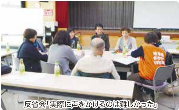
反省会「実際に声をかけるのは難しかった」