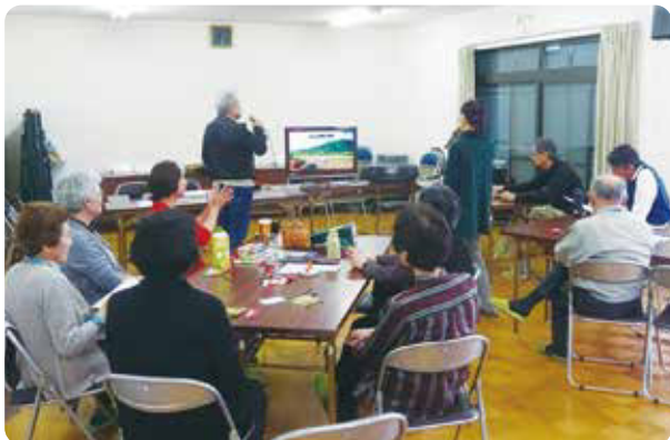
★カラオケを楽しむ様子

今年4月より活動をスタートした新しいサロンです。地域のどなたでも参加が可能です。活動は、カラオケを歌いながら交流することを主としていますが、参加者の希望を聞きながら毎月新しいことに挑戦しています。