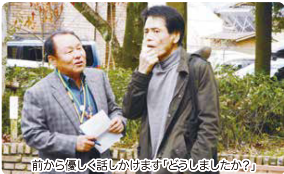
前から優しく話しかけます「どうしましたか？」

3月22日に、太平公園と総合福祉センターの周辺で、認知症サポーターを対象に徘徊模擬訓練を開催しました。徘徊模擬訓練とは、認知症の人が道に迷ってしまった時を想定して、認知症役の役者に声をかけて通報し、安全な保護につなげる取り組みです。