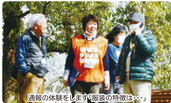
通報の体験をします「服装の特徴は・・・」