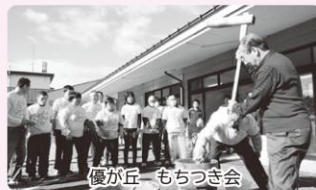
優が丘 もちつき会