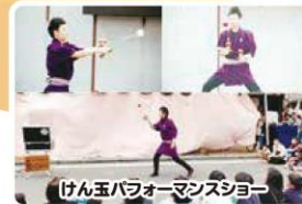
けん玉パフォーマンスショー