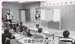
児童館将棋まつり