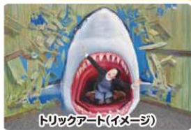
トリックアート(イメージ)