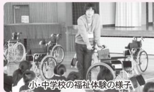
小・中学校の福祉体験の様子