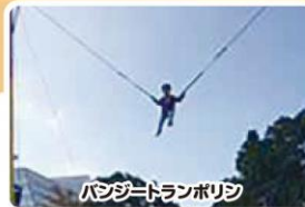
バンジードランポリシ