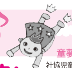
童夢くん 社協児童館・児童センターキャラクター