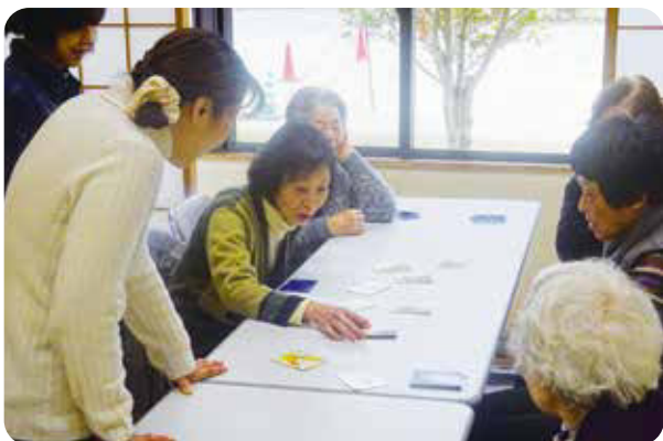
★岐阜県方言カルタでお正月気分♪

第1火曜日に「地域住民のふれあいと気軽に楽しむことができる場」として開かれているサロンです。活動内容は、脳トレや健康体操などさまざまで、みなさん楽しい時間を過ごしています。どなたでも参加できますのでお越しください。