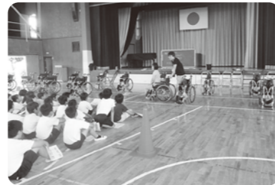
小学校での福祉体験