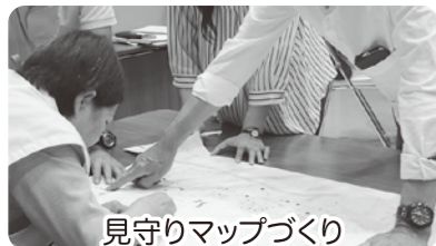
見守りマップづくり