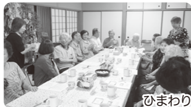
ひまわりサロン活動