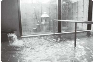
多治見市滝呂老人福祉センター 浴室