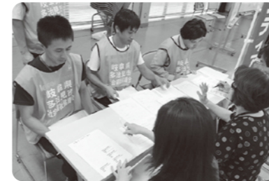
災害救援ボランティアセンター設置訓練