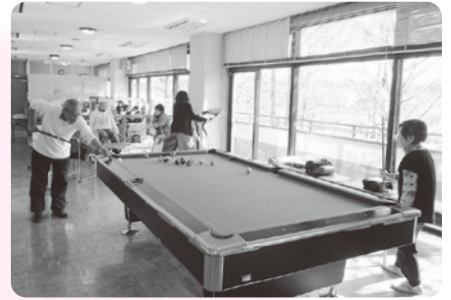
多治見市老人福祉センター 娯楽室

60歳以上の方を対象に、教養を高める講座や体力の維持・増進のための教室などを開催し、高齢者の介護予防や生きがいづくり、レクリエーションのほか、世代を超えた交流の場として気軽に利用できます。詳細は各館に問い合わせください。