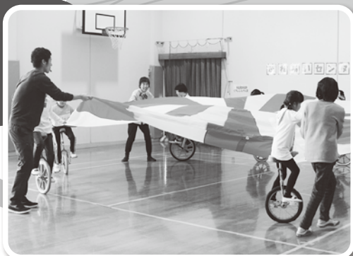
児童センター『一輪車クラブのバルーンを使った演技披露』&『子どもスタッフあそびのコーナー』