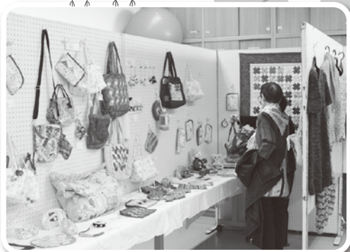
老人福祉センター『作品展』&フラダンス教室『フラハイビスカスのダンス』