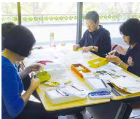
仕分け活動の様子

昭和59年に多治見市社会福祉協議会の呼びかけで発足し、寄付していただいた『ベルマークや古切手の整理、計算・集計をし、地域福祉に役立てることを目的』として活動しています。