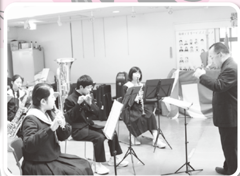
南姫中学校吹奏楽部の演奏