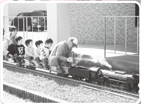
森の汽車倶楽部による「SL乗車体験」

3月2日に地域のみなさんの協力を得て、恒例の「ふれあいセンター姫まつり」を開催しました。午前中はミニSL体験・マジックショー・吹奏楽部の演奏・カフェ・グルメ・科学コーナーなどを行い、午後の部ではフラダンス・一輪車の発表・あそびのコーナーなど、子どもからお年寄りまでみんなで一緒に楽しい時間を過ごすことができました。