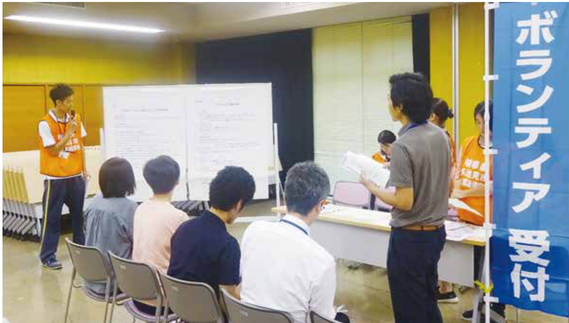
7月5日の災害救援ボランティアセンター設置運営訓練(社協職員訓練)の様子