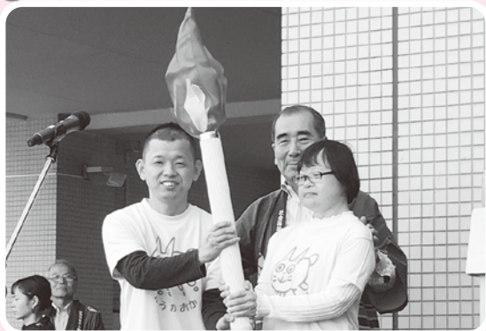
開会式では聖火台に炎を灯しました