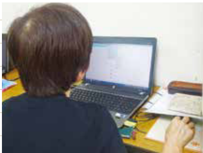
パソコンでの点訳の様子

昭和59年1月に発足し、視覚障がい者が情報を得るための新聞や広報紙などを点字にする点訳活動をしています。