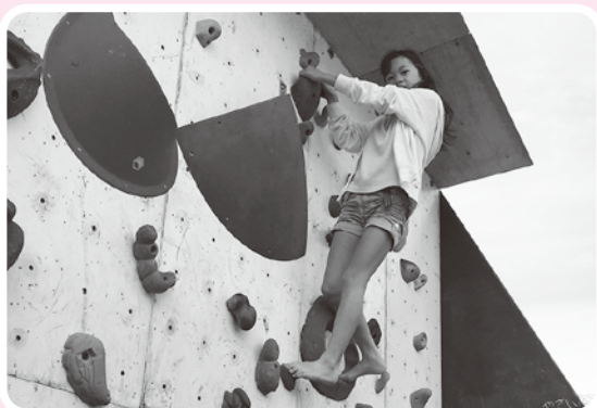
オリンピック新競技のボルダリングに挑戦!

10月26日に総合福祉センターで「ふれあい福祉まつり」を開催しました。今年はオリンピック・パラリンピックの競技種目であるアーチェリーやボルダリング、ブラインドサッカー、ボッチャなどの体験を行いました。ステージでは一輪車の発表や消防音楽隊による演奏、フリースタイルフットボーラーによる巧みな技の披露など、盛りだくさんの内容で楽しみました。