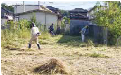
草刈り支援の様子