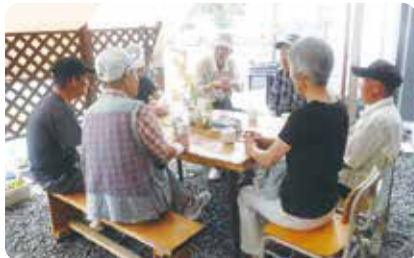
オープンカフェの様子