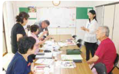
社会資源マップ作りの様子