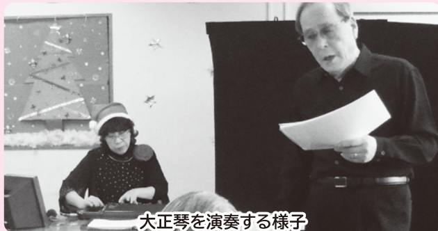
大正琴を演奏する様子

フルールは、福祉施設の敬老行事やイベントで慰問するボランティアで、大正琴の演奏とマジックを中心に夫婦で活動しています。フルールとは「一輪の花」という意味です。初めての慰問先で、庭で摘んだタンポポをカップに入れて飾ってもらったことがとても嬉しかったことから名付けました。二人は「ご利用者の皆さんに少しでも楽しんでいただけるのなら、できる限り頑張ります。」と活動に意欲的です。