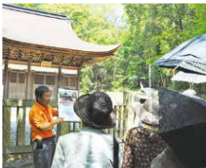
虎渓山永保寺を案内する様子