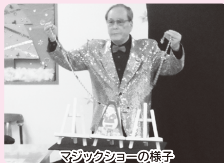
マジックショーの様子

ボランティアセンターでは、福祉施設を慰問して下さるボランティアを募集しています。楽器の演奏のほか、歌や踊り、手品や漫談など一芸をお持ちの皆様をお待ちしています。また、話し相手や行事を手伝って下さる個人ボランティアも募集していますので、関心のある方は下記までご連絡ください。