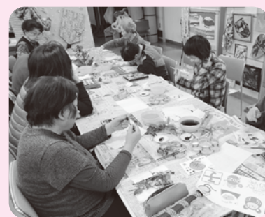
絵手紙教室の様子

場 所 障害者福祉センター (総合福祉センター2階) 時 間 教室 (午前)10時～正午 開催 (午後)午後1時30分～午後3時30分 時間 (終日)午前10時～午後3時30分 ※開館時間は午前9時～午後5時 対 象 多治見市内在住で生活の中心が在宅の18歳以上の方で、障害者手帳等をお持ちの方。 定 員 各教室10～15人程度 参 加 費 無 料(材料費等の負担をいただく場合があります。) 送 迎 必要に応じて送迎します。(要相談) 申し込み 随時募集しています。