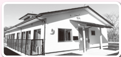
④ 障がい者グループホームの運営