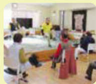
サロン活動の様子