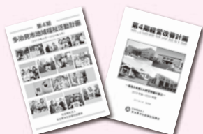
① 第4期地域福祉活動計画・第4期経営改善計画

令和元年は、大型台風の接近や通過によって全国いたるところで暴風雨災害が発生し、甚大な被害をもたらしました。平成30年度末に締結した「東濃5市社会福祉協議会災害時相互支援に関する協定」の運用の実現に向け、相互の連携体制を構築・強化し、合同で災害ボランティアセンターを設置する訓練を行うことによって、広域における災害発生時の体制づくりを整備します。