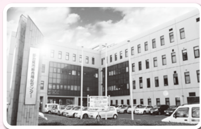
③ 総合福祉センターなど指定管理施設の運営