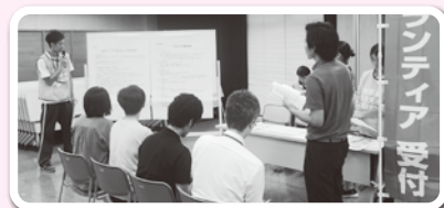
⑤ 災害ボランティアセンター設置訓練