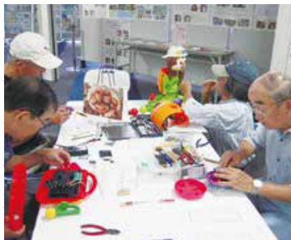
おもちゃの修理の様子

平成17年4月1日に設立し、無料で壊れたおもちゃの修理をするボランティア団体です。おもちゃの修理を希望される方は、下記の日程でお越しください。