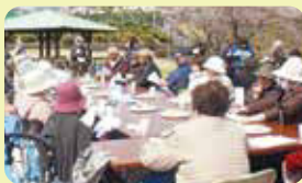
ふれあいサロンの様子