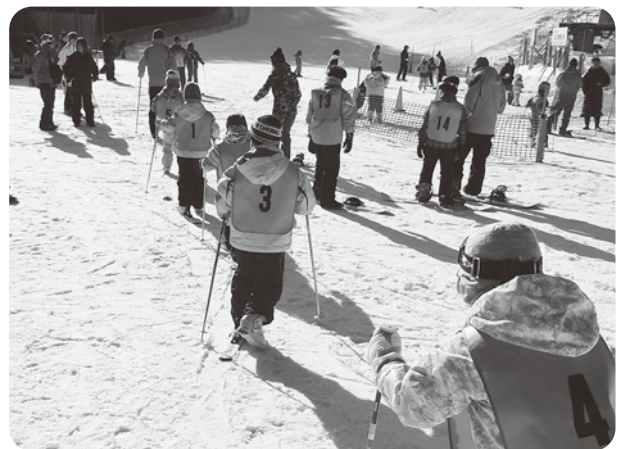
スキー・スノボツアーの様子

歳末たすけあい募金は共同募金運動の1つです。 寄せられた募金は、地域の見守り活動などに使われるほか、地域福祉サービス事業などに活用されます。 昨年度は、市内福祉施設の作品展示会「ふれあい作品展」やひとり親家庭支援として「スキー・スノボツアー」の開催などに使われました。