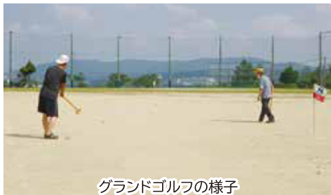
グランドゴルフの様子

外で快適にグランドゴルフをしませんか？初心者でも気軽にできますので、男性女性を問わず、是非ご参加ください。 ※雨天時は中止する場合があります。