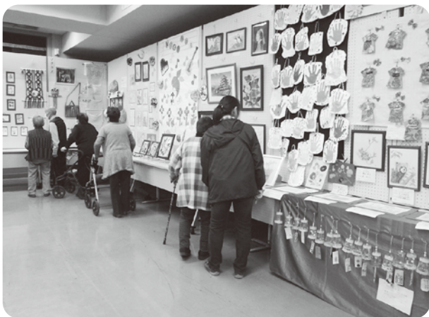
ふれあい作品展の様子