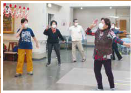
健康体操教室の様子(南姫老人福祉センター)

男性のみを対象とした教室や、運動ばかりではなく、習字など趣味活動の教室など豊富な内容の教室を各センターで行っています。お近くのセンターでぜひご参加ください! 感染防止に努めて開催しています!