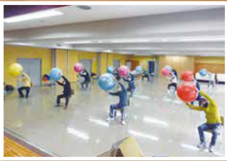
バランスボールの様子(太平老人福祉センター)