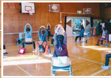
バランスディスクの様子(滝呂老人福祉センター)