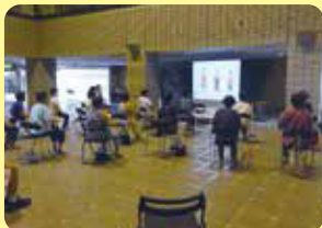
産文体操サロンの様子