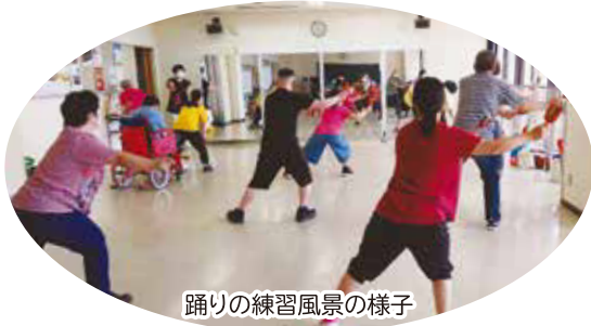
踊りの練習風景の様子

障がい児・者の仲間づくり、健康づくりを主な目的として毎月第3日曜日に活動しています。講師を招いて踊りの練習を行い、まつりなどの市内のイベントで披露をしています。障がいのある方やその家族、障がいについて関心のある方など、どなたでも参加可能です。