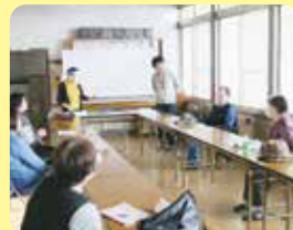
市之倉手話サロンの様子

問い合わせ 地域福祉課 電話 (25)1134 FAX (25)1132 〈担当〉藤井