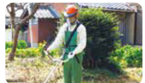
「あったらいい活動」の草刈りの様子