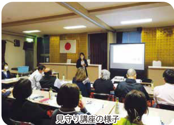
見守り講座の様子