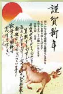
多世代年賀状 交流事業