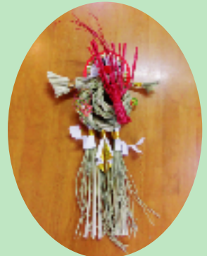
福祉課 根本児童センター