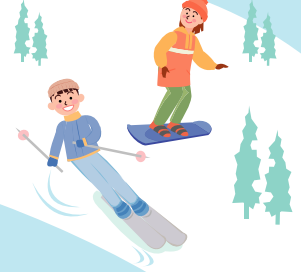
福祉課 母子福祉センター