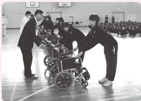
南ヶ丘中学校での贈呈式(2月17日)

アルミ缶回収の収益で車いすを購入し、多治見市社会福祉協議会や近隣の福祉施設に寄付していただきました。贈呈式では、多くのアルミ缶を集めるために工夫したこと、家族や地域の方の協力に感謝するなど、児童・生徒が1年間の活動を振り返り、その成果を発表しました。