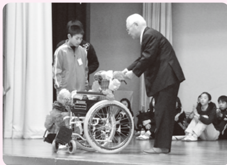
笠原小学校での贈呈式(3月7日)

車いすは、社会福祉協議会が実施する貸出事業のほか、それぞれの障害者や高齢者の施設で使用します。