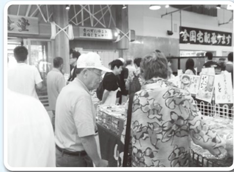
市場での買いもの