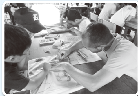
協力してチーム旗作り