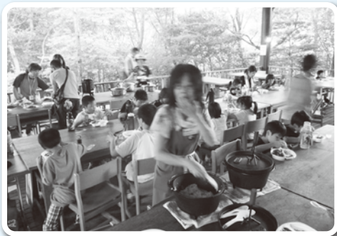
みんなで作ったカレーで夕食

生まれて初めて親と離れて宿泊する子もありましたが、食事づくりや英語によるパネルシアター、天文観測、工作、チーム対抗ゲームなど、みんな夢中になって仲間たちと遊んでいました。また、おやつには炭火でマシュマロを焼いて食べたり、夜には怖い話をドキドキしながらも真剣に聞いたり、楽しい体験をすることができ、迎えに来た保護者の方に笑顔で報告していました。