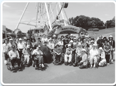
南知多ビーチランドにて

当日は天候にも恵まれ、25組50名の参加者は、イルカショーを見たり、アシカとの触れ合いを楽しんだりしたほか、海産物の市場では、お土産を買ったり、新鮮な海の幸を味わうなど、充実した一日を過ごしました。また車中では話が弾み、参加者同士での交流もすることができました。