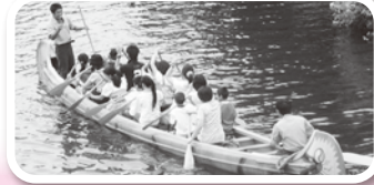
昨年、ディズニーランドに行きました

会員は、「子育てや生活について身近に相談できていい」「いろいろな制度があることが分かってよかった」とコミュニケーションの大切さを実感しています。