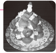
クロカンブッシュ

問い合わせ・申し込み 電話/FAX (25)1133 メール boshi@t-syakyo.or.jp