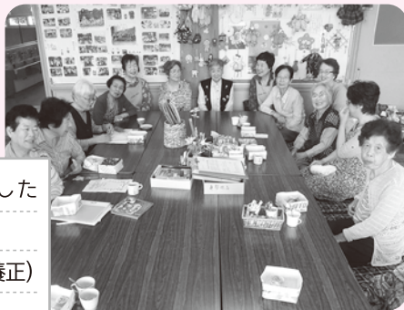
高齢者を中心とした サロン (ふれあいサロン養正)