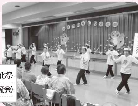
ひまわりサロン文化祭 (全サロンによる交流会)