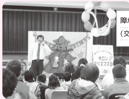
障がい児者サロン (交流会の様子)