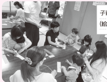
子育てサロン (絵本を楽しむ会)

各地で行われている様々な活動のうち、多治見市社会福祉協議会に登録し、住民の誰もが自由に参加できる集まりを「ひまわりサロン」と呼んでいます。登録いただくことで、運営に関する相談や活動研修会等への参加、サロンの保険への加入、助成金の交付などを受けることができます。