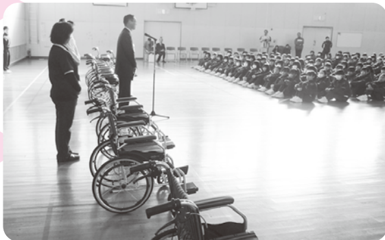
南ヶ丘中学校 2台寄付