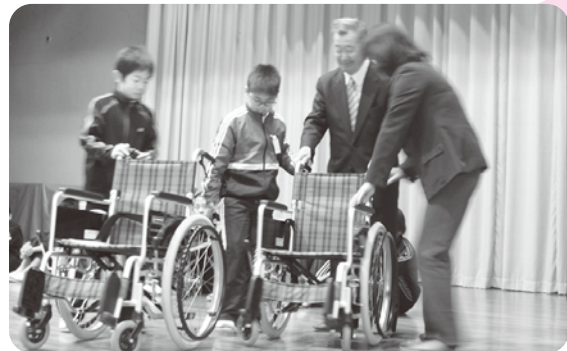
笠原小学校 2台寄付