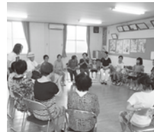
移動老人センター (滝呂台で児童と交流)