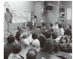
うさぎの会の様子