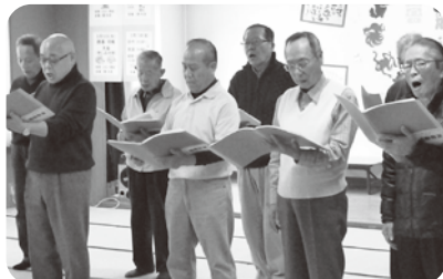
「おじんの唱歌教室」大熱唱!

作品展には、多治見市悠光クラブ連合会会員の作品や、写真、習字等の老人福祉センターの各種教室、サークルの力作を展示し、600人を超える来場者は、様々な作品に刺激を受けていました。