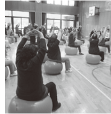
バランスボール教室