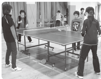
児童との卓球大会

また、複合施設の利点を活かし、児童センターやデイサービスセンターとも共催で行事を行い、幼児から高齢者まで交流を深めています