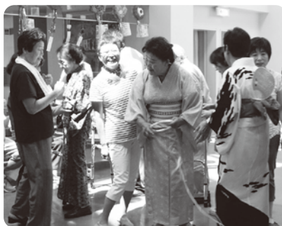
デイサービスとの夏祭り