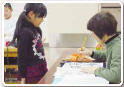
子ども達の作品と教室の様子

母子・父子福祉センターでは、ひとり親家庭のお子さんの為の「子どもの習字教室」を毎月第1.3月曜日午後6時から7時に開催しています。今年入った子も先生の熱心な指導でめきめき腕を上げていて、卒業の頃にはみんなとてもうまくなっています。