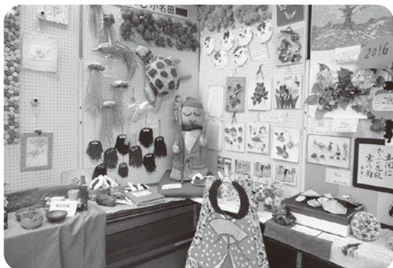
昨年の作品の一部