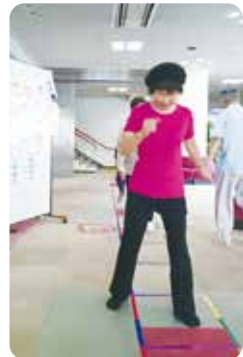
〈みなさんの体験の様子 男女問わず楽しみながらできます〉