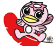
多治見市マスコットキャラクター うながっぱ