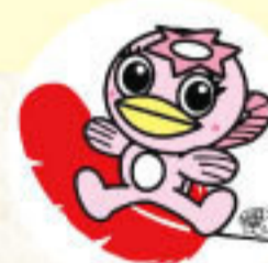
多治見市マスコットキャラクター うながっぱ