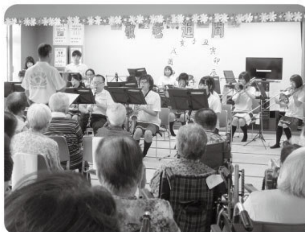
多治見市消防音楽隊による演奏