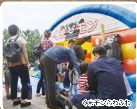
くまモンふわふわ