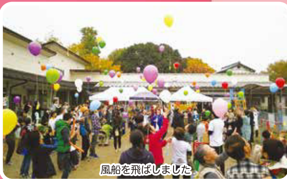
風船を飛ばしました