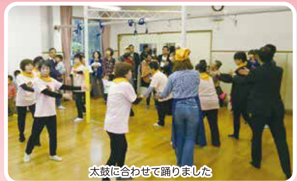
太鼓に合わせて踊りました