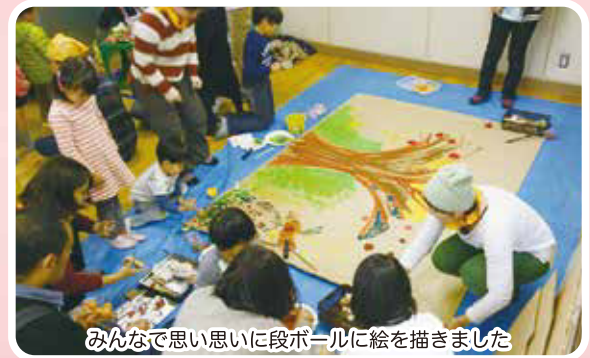
みんなで思い思いに段ボールに絵を描きました

まつりの最後は参加者みんなで施設で育ったあさがおの種とみんなのメッセージを付けた風船を飛ばしました。