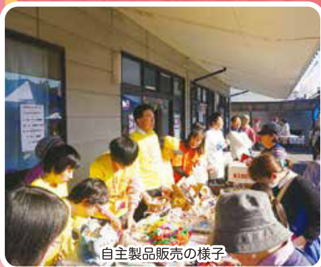
自主製品販売の様子