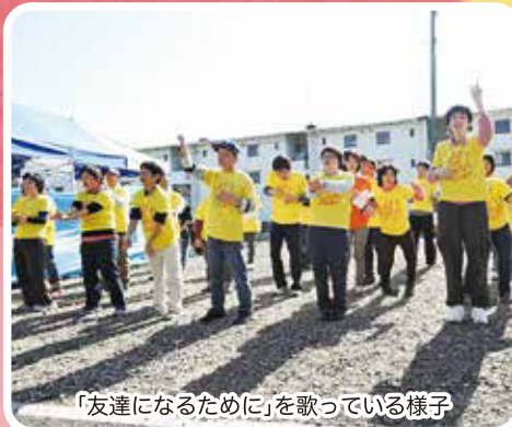
「友達になるために」を歌っている様子