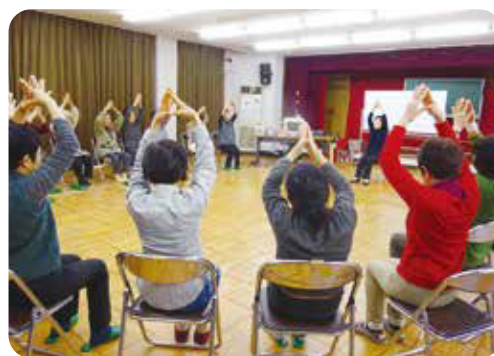
NIG(ねもといきいき元気)健康講座 平成28年度 4回開催

問い合わせ 根本校区地域福祉協議会(ふれあいねもと) 北丘町1-73 電話(27)6605