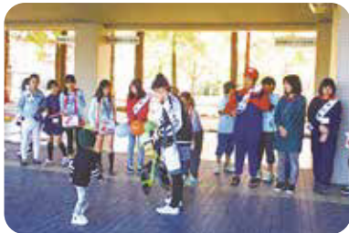
子どもスタッフまつり (総合福祉センターにて)

児童館、児童センターの子どもスタッフも、より良い町にするために募金活動がんばっています。29年度もぜひ、ご協力をお願いいたします。