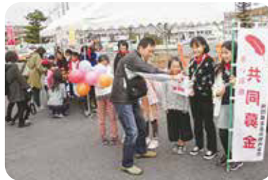
小泉校区 青少年まちづくり市民会議 もちつき大会(小泉公民館にて)