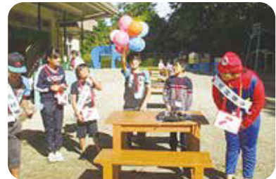
エンジョイ・わっしょい児童館まつり (共栄児童館にて)