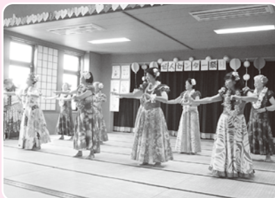
フラダンス教室の発表