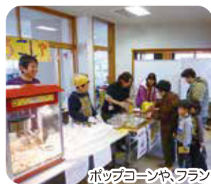
ポップコーンやフランクフルトなど販売しました