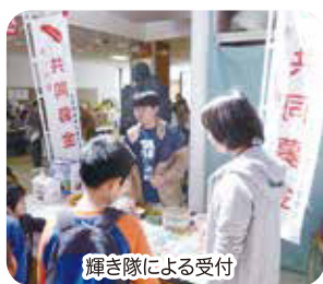
輝き隊による受付