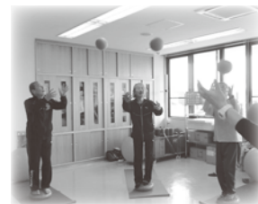
男の運動教室の様子