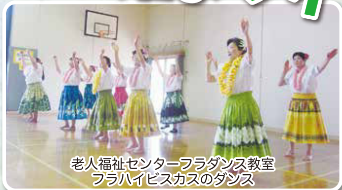
老人福祉センターフラダンス教室 フラハイビスカスのダンス