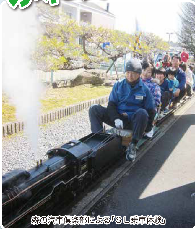
森の汽車倶楽部による「SL乗車体験」