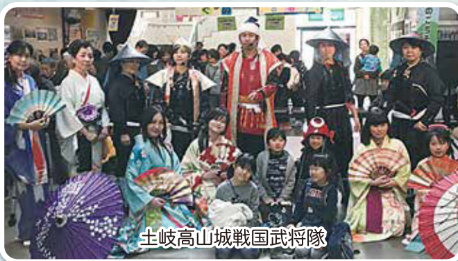
土岐高山城戦国武将隊