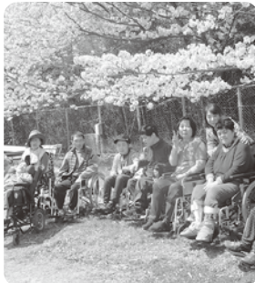
近くの公園にて 《生活介護》 花フェスタ記念公園にて