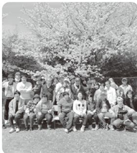
《就労支援》 近くの公園にて 《生活支援》