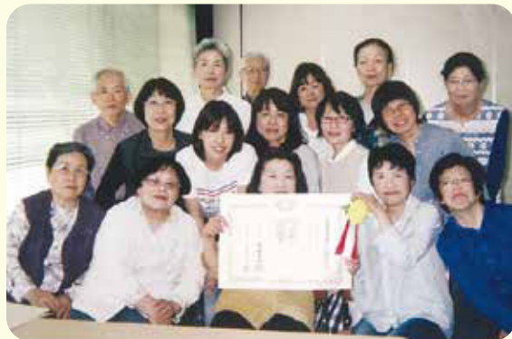
多治見手話サークル 桔梗の会 昼の部(一部)

主な活動は、多治見市役所や市民からの依頼で聴覚障害者への通訳や、福祉教育として小中高等学校に限らず幅広く手話を教えています。 今回の受章は、発足以来38年間に渡る活動が、地域福祉に多大な貢献をしたとして評価されたものです。