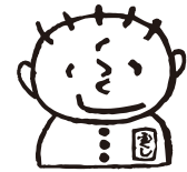
社協たじみ公式キャラクター「ふくしくん」