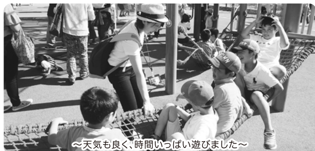
～天気も良く、時間いっぱい遊びました～