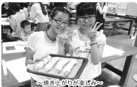
～焼き上がりが楽しみ～

初めて参加した4家族は、体験や遊びなどを通して子ども同士・親同士での交流ができ、友だちづくりの機会になりました。今後も、初めてでも参加しやすい行事を企画をしますので、ぜひ気軽に参加してください。