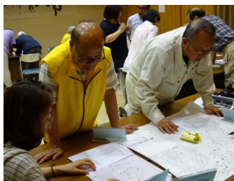
民生児童委員とともに地域の見守り マップを更新する福祉委員

民生児童委員との連携や地域の見守り、福祉講座の企画などを行う福祉委員活動を支援します。