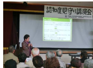
市之倉地域福祉協議会 認知症見守り講演会の企画運営