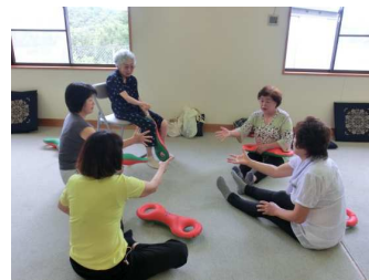
ひまわりサロン「たんぼぼの会」 3B体操で健康づくり

町内会や区など身近な場所での生きがいづくり、健康づくり、閉じこもり防止を目的とした「集いの場」の活動を支援しています。