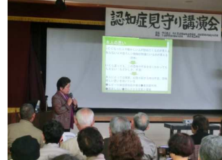
市之倉地域福祉協議会 認知症見守り講演会の企画運営