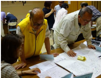
民生児童委員とともに地域の見守り マップを更新する福祉委員

民生児童委員との連携や地域の見守り、福祉講座の企画などを行う福祉委員活動を支援します。