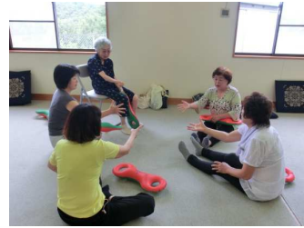
ひまわりサロン「たんぼぼの会」 3B体操で健康づくり

町内会や区など身近な場所での生きがいがつくり、健康づくり、閉じこもり防止を目的とした「集いの場」の活動を支援しています。