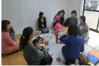
北栄地域福祉協議会 子育てサロン「がきんちよ」の運営