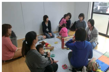
北栄地域福祉協議会 子育てサロン「がきんちよ」の運営